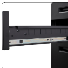
Leichtes Herausnehmen der Schubladen