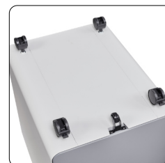
Einfaches Stecksystem zur Befestigung der Rollen