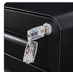
Zylinderschloss inkl. 2 Schlüssel